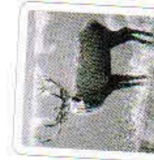
Le cerf brame.