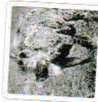
La hyène ricane.