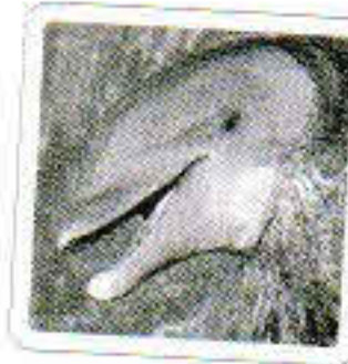
Le dauphin couine.

et le vainqueur de la partie crie : "Youpi !"