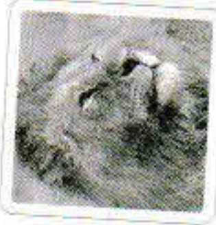
Le lion rugit.