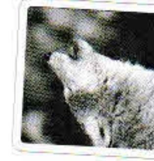
Le loup hurle.