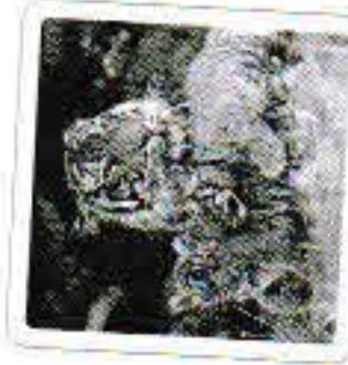
Le tigre feule.