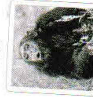
Le singe crie.