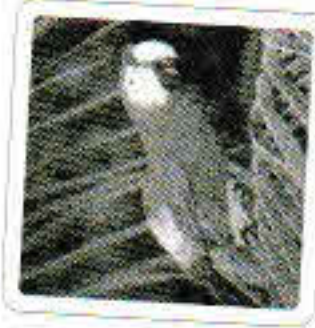
Le perroquet jase.