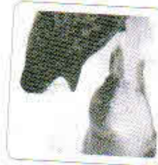
Le phoque bêle.