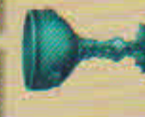
Le Calice de l'onde

3. SÉPARER LES CARTES : Séparez les cartes en trois piles correspondant à chacun des dos : pile Inondation (dos bleu), pile Trésor (dos orange), et cartes Aventurier (6 cartes).