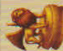
La Statue du zéphyr