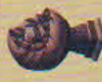
La Pierre sacrée