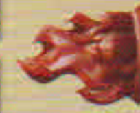
Le Cristal ardent