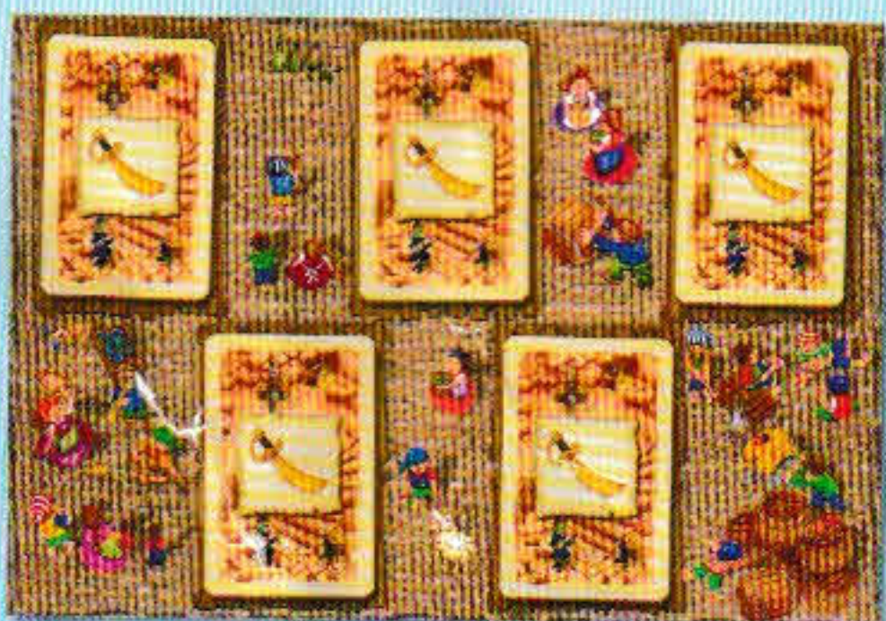
Un marché avec cinq cartes identiques.