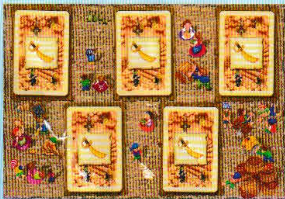
Un marché avec cinq cartes identiques.