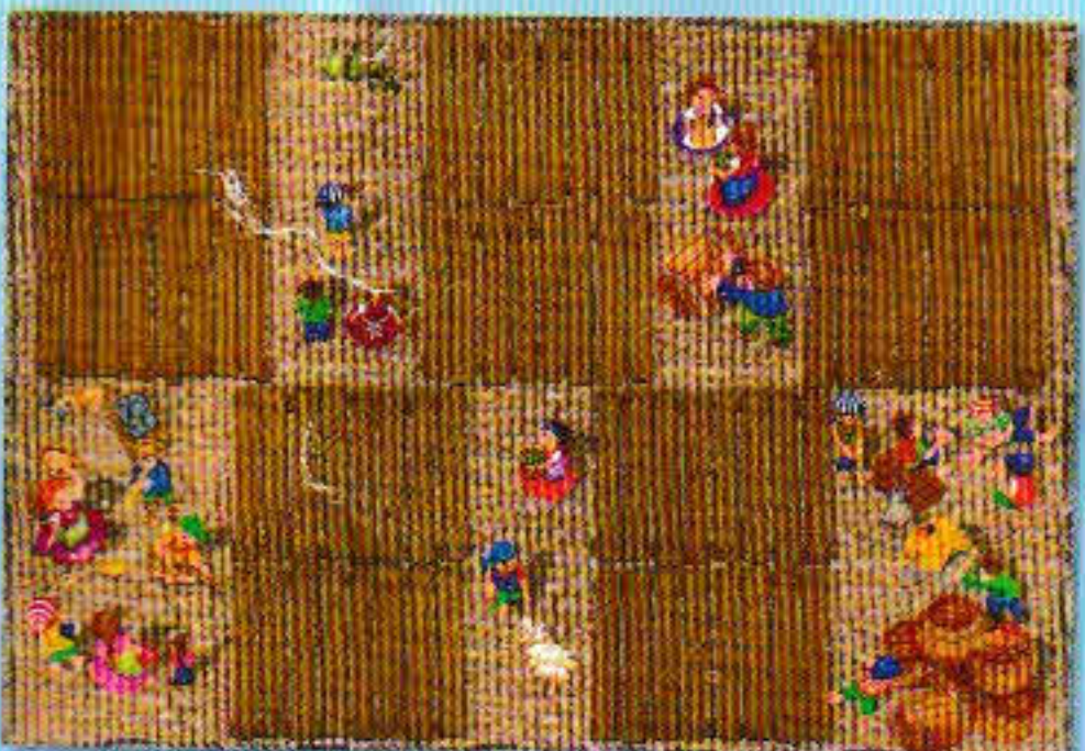
Toutes les cartes retournent dans la réserve.