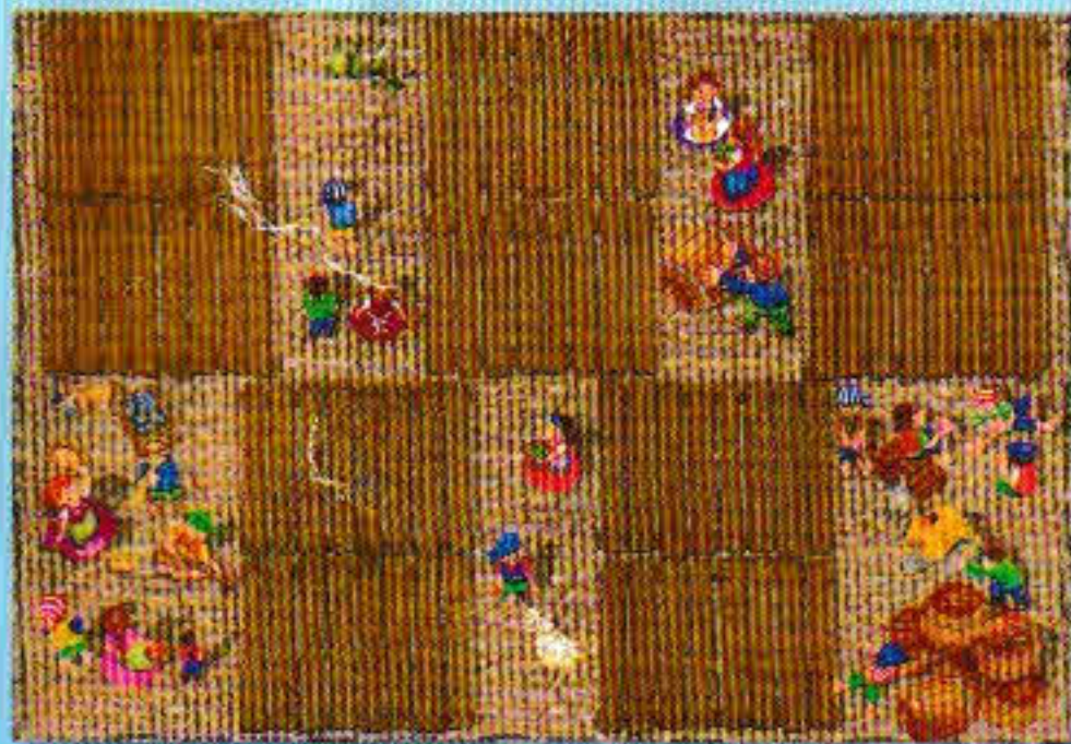
Toutes les cartes retournent dans la réserve.