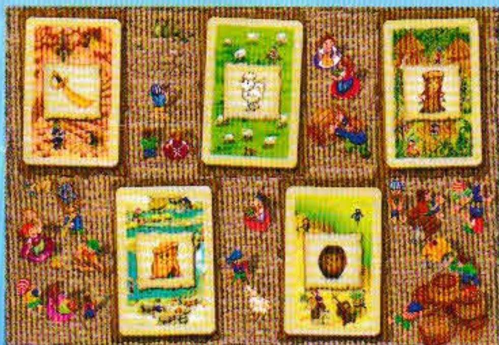
Cinq nouvelles cartes (une de chaque type) sont placées.