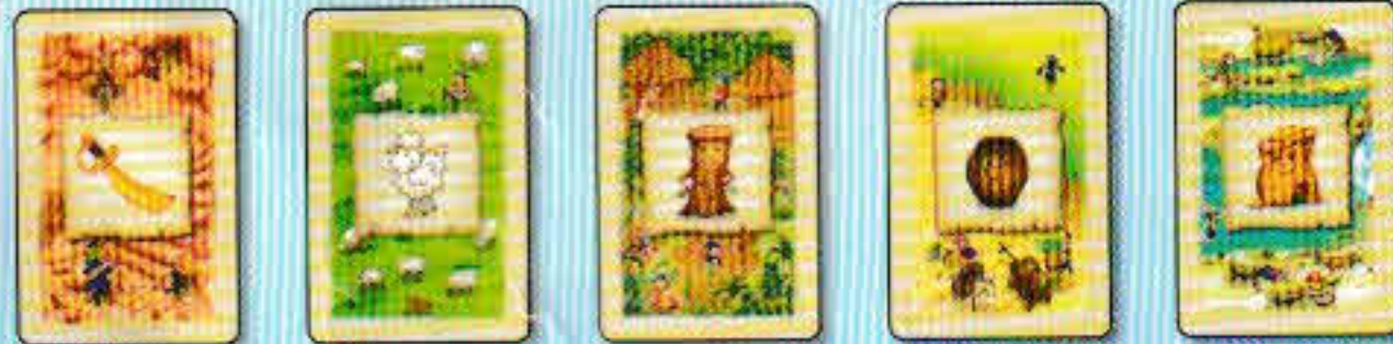
Sabre Laine Bois Rhum Or