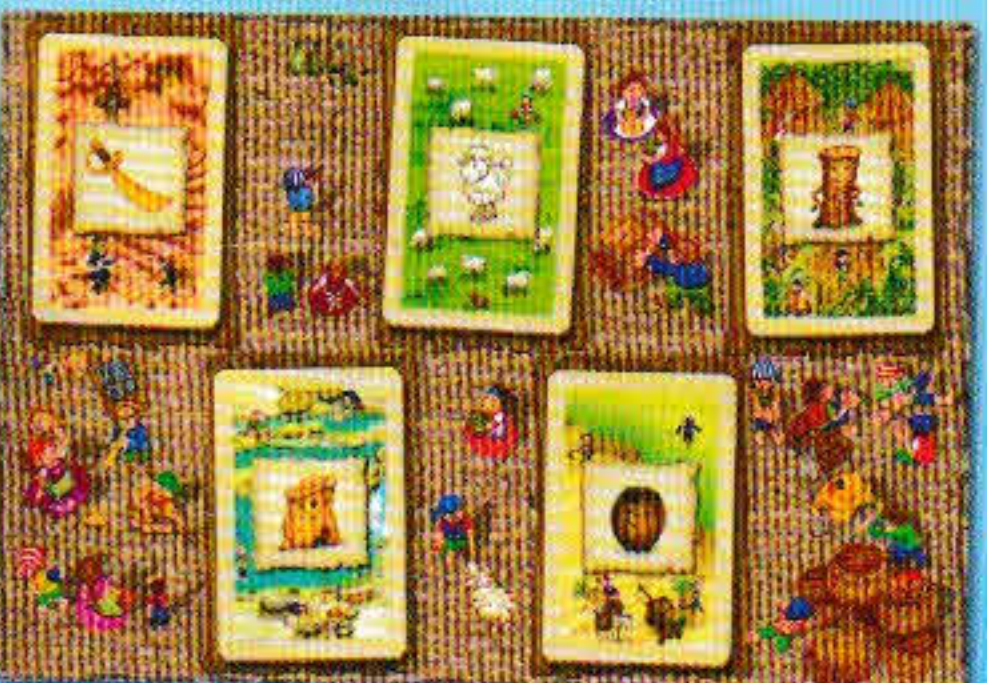
Cinq nouvelles cartes (une de chaque type) sont placées.