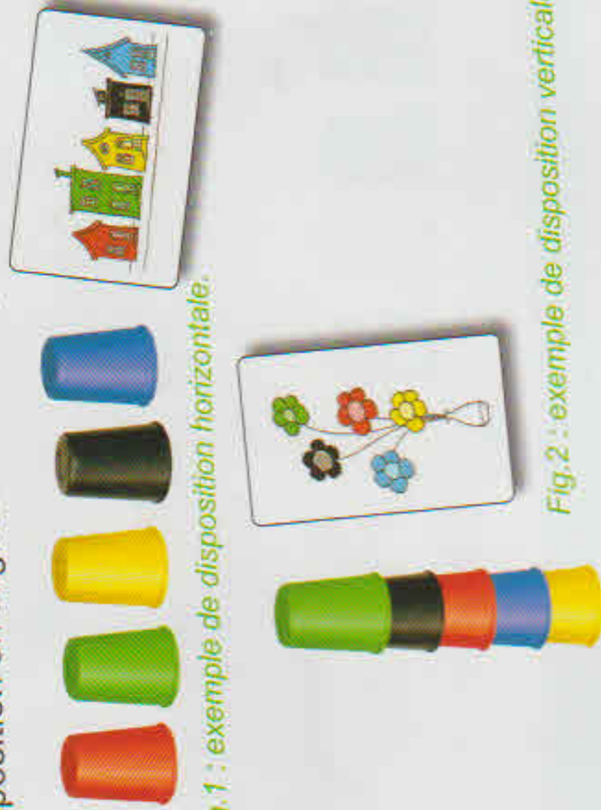
Fig.1 : exemple de disposition horizontale.

Attention : les éléments sont parfois représentés horizontalement (voir fig.1) et parfois verticalement (voir fig.2). Il faut veiller à bien respecter cette disposition en alignant ou en empilant ses gobelets.