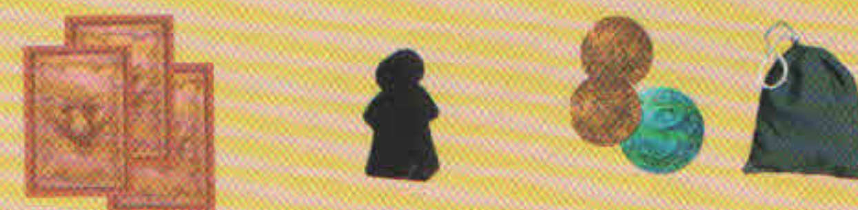
Cartes Édifices Ouvriers Pesos Sac

Chaque joueur choisit 2 cartes parmi les 13 qu'il a en main et les place dans un premier temps face cachée devant lui. Une fois que chacun a choisi ses cartes, tous les joueurs peuvent retourner face visible leurs 2 cartes qu'ils ordonnent selon leur valeur croissante : la carte de plus petite valeur à gauche, la plus grande à droite.