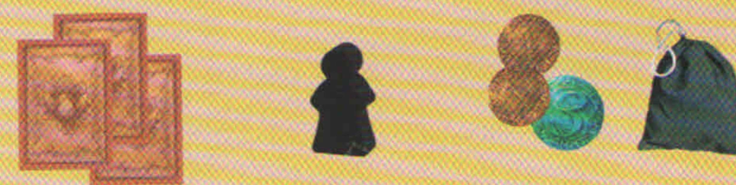
Cartes Édifices Ouvriers Pesos Sac

Chaque joueur choisit 2 cartes parmi les 13 qu'il a en main et les place dans un premier temps face cachée devant lui. Une fois que chacun a choisi ses cartes, tous les joueurs peuvent retourner face visible leurs 2 cartes qu'ils ordonnent selon leur valeur croissante : la carte de plus petite valeur à gauche, la plus grande à droite.