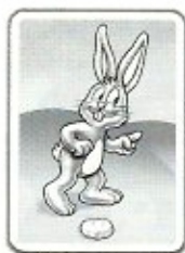
Avance d'1 case

Lorsque tu tires une carte représentant un lapin, avance l'un de tes lapins vers le sommet du nombre de cases indiqué.