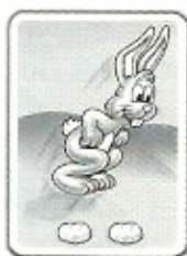
Avance de 2 cases