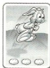
Avance de 3 cases