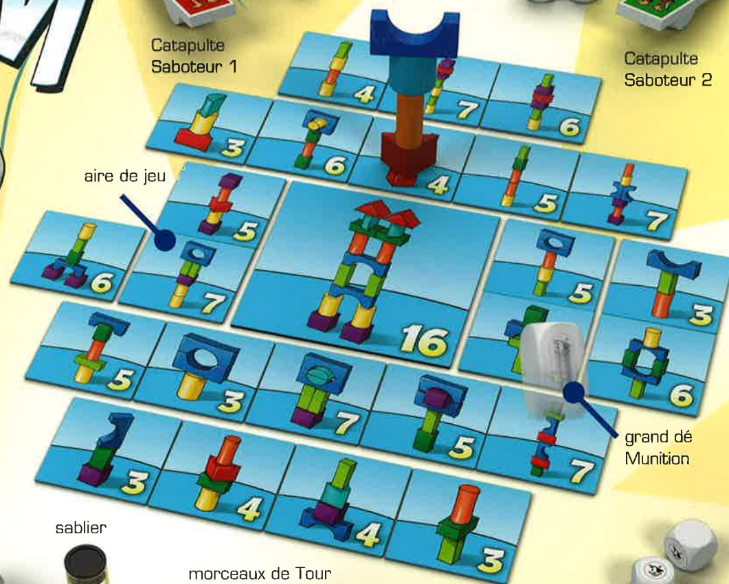
grand dé Muniton