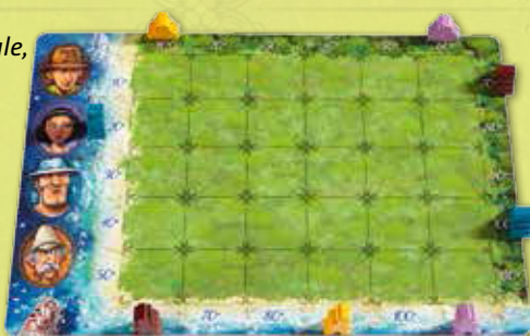
Exemple de configuration des îles au début de la partie

Il ne reste plus que l'aventurier marron, que Louis choisit de positionner à 60° sur la plage. Il décide ensuite de placer son temple marron à 70° côté jungle, ce que les autres joueurs font également.