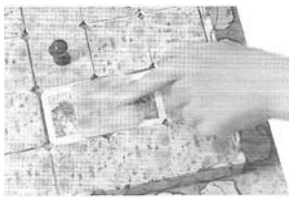
Déplacer une seule carte

Le joueur le plus jeune commence la partie, le jeu se déroule ensuite dans le sens des aiguilles d'une montre. Une fois que ton tour de jeu arrive, tu disposes de deux coups. Lorsqu'il sera à ton tour de jouer, tu pourras déplacer une seule carte, ou toute une série de cartes (une colonne), jusqu'à ce que ta carte ou colonne bute contre une autre carte OU contre le bord de la boîte. S'il existe déjà un espace de plus de 1 case au début de ton tour, c'est-à-dire s'il existe 2 ou 3 cases vides côte à côte, tu pourras si tu le souhaites arrêter de pousser tes cartes avant même de buter contre une autre carte ou contre le bord.