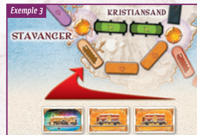
Exemple 3 Pour s'emparer de la ligne de ferries reliant Stavanger à Kristiansand, un joueur doit jouer au moins une locomotive et compléter avec des cartes Wagon orange.