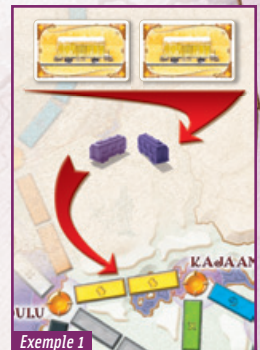
Exemple 1 Pour s'emparer de la route jaune, un joueur doit jouer deux cartes Wagon jaunes.

Certaines villes sont reliées par une route double. Un même joueur ne peut en aucun cas contrôler les deux routes parallèles reliant les deux mêmes villes. Dans une partie à deux joueurs, une seule de ces deux routes peut être utilisée. Dès qu'un joueur a pris possession de l'une des deux routes parallèles, l'autre est fermée et inaccessible pour la suite de la partie.