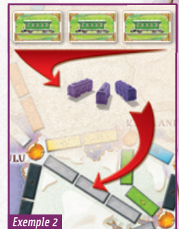
Exemple 2 Pour s'emparer de la route grise, un joueur doit jouer trois cartes Wagon d'une seule et même couleur.