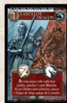
Lancelot & Dragon