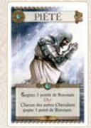
Carte Blanche Spéciale