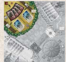
LANCELOT ET LE DRAGON