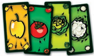
cartes Légumes :

Joueurs : 2 à 6 Âge : à partir de 6 ans Durée : 10-20 min