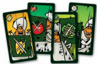
cartes Légumes tabous :

Joueurs : 2 à 6 Âge : à partir de 6 ans Durée : 10-20 min