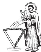
Case « Raccourci »

Sur le plateau se trouvent 6 cases sur lesquelles est dessiné à chaque fois un petit triangle de couleur différente. Lorsque vous vous arrêtez sur cette case, rendez-vous directement à la case Quartier Général de Catégorie de la même couleur. Si vous répondez correctement à la question qui vous sera posée, vous gagnez le triangle marqueur.