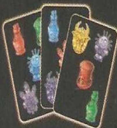
Main de Nils