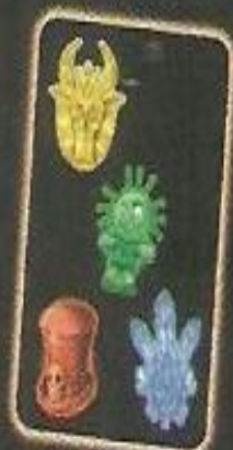
Carte du jeu de Léa

La potion magique lilas manque sur la première carte ingrédient de la pile Vaudou. Léa pose sur la pile Vaudou une carte ingrédient sur laquelle manque également la potion magique lilas et crie Voodoo. D'abord Olivier, puis Nicolas doivent alors piocher la carte ingrédient du dessous de la pile Vaudou et la poser sous leur pioche respective