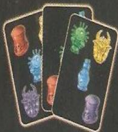
Main de Léa