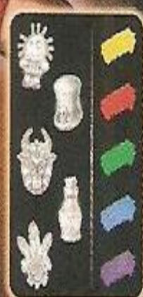
cartes ingrédients (face avant/face arrière)