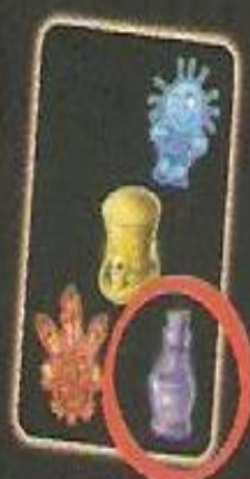
Carte du jeu d'Olivier

L'ingrédient potion magique et la couleur lilas manquent sur la première carte ingrédient de la pile Vaudou. La combinaison recherchée est donc la position magique lilas, comme Olivier l'a par exemple dans sa main. Quand Olivier pose alors sa carte ingrédient sur la pile Vaudou, il crie à haute voix « potion magique lilas ». Tous les joueurs doivent ensuite chercher une carte ingrédient avec un masque vert.