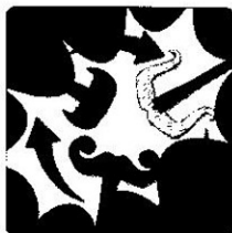
Ne frappe pas ! Passe ta moustache !