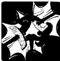
Tout le monde tape !