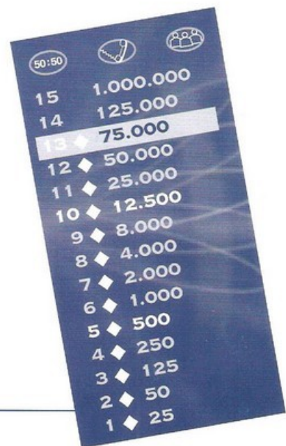
La tour d'argent

Le jeu peut aussi se dérouler exactement comme dans le jeu télévisé. Un joueur est le maître de jeu et pose les questions. Un deuxième joueur est le candidat qui répond aux questions. Les autres joueurs constituent le public et peuvent aussi être choisis en tant qu'ami.