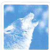
Le loup hurle.