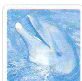
Le dauphin couine.

et le vainqueur de la partie crie : "Youpi !"