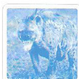
La hyène ricane.