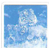
Le tigre feule.