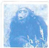
Le singe crie.