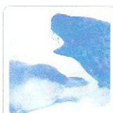
Le phoque bêle.