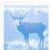
Le cerf brame.