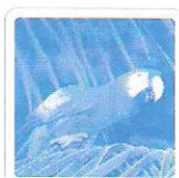
Le perroquet jase.