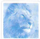
Le lion rugit.