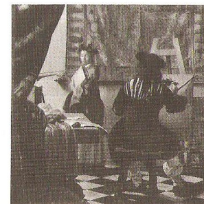
JAN VERMEER The artist in his studio Der Meister in seinem Atelier