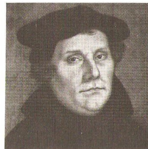
LUKAS CRANACH Dr. Martin Luther Dr. Martin Luther