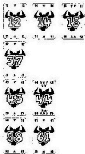
Fig. 2: Les quatre séries après le premier tour.

Le „14“ est la carte la plus faible. C'est elle qui sera la première à être déposée dans une rangée. Selon la règle n°1, elle ne peut être déposée que dans la première série, derrière le „12“. De même pour le „15“. Selon la règle n°1, la carte „44“ peut être déposée aussi bien dans la 1ère, que dans la 2ème ou la 3ème série. Mais, d'après la règle n°2, la règle de „la plus petite différence“, elle doit aller dans la 3ème série. D'après la règle n°2, la carte „61“ doit être déposée dans la quatrième série.