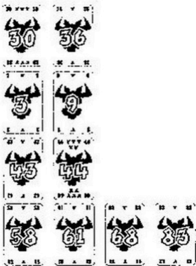
Fig. 4: Les quatre séries après le 3ème tour.

3, 9, 68 et 83. Etant la carte la plus faible, le „3“ doit être déposé le premier. Il ne peut entrer dans aucune des séries. Le joueur qui a joué le „3“ doit donc ramasser une série de son choix. Il choisit la série 2 et prend le „37“. Avec son „3“, il commence une nouvelle série. Le joueur qui a joué le „9“ a eu de la chance, car il peut maintenant mettre sa carte après le „3“.