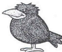
Illustration : J. Krause