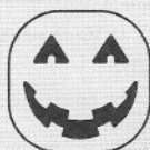
tête de citrouille

toutes les cartes de l'image de la bande sont au milieu du plateau de jeu : fin du 1er tour, poser la carte-citrouille sur une maison