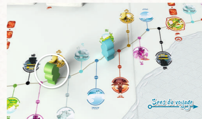
Le Voyageur vert est le plus loin sur la route, c'est donc à lui de jouer.

C'est le cas, jusqu'à ce que son pion Voyageur se retrouve devant celui d'un autre joueur.