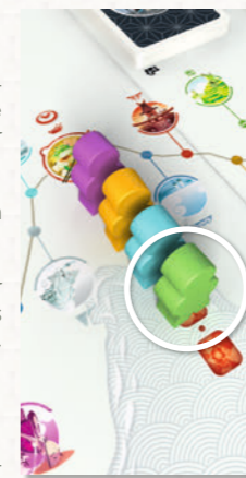
Le Voyageur vert repartira le premier du Relais

Le premier Voyageur occupe obligatoirement l'emplacement le plus près de la route. Les autres Voyageurs forment une file derrière lui.