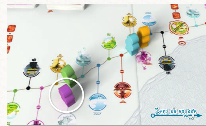
Le Voyageur violet est considéré plus loin que le Voyageur vert (emplacement double). C'est donc à lui de jouer.