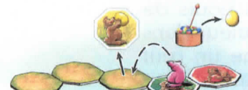
Fig. 4: There are only face down yard tiles in front of Clara's Gulo. As such, she has to turn over the first yard tile in front of her Gulo. It happens to be a yellow one and therefore she steals a yellow egg from the nest.

Illustr. 3: il y a beaucoup de bouts de chemin, faces visibles, devant le glouton de Vanessa. Elle peut retourner le bout de chemin suivant (X). Mais elle ne le fait pas et décide de prendre un œuf rouge pour pouvoir faire avancer son glouton aussi loin que possible (voir chapitre 2: le déplacement du glouton).