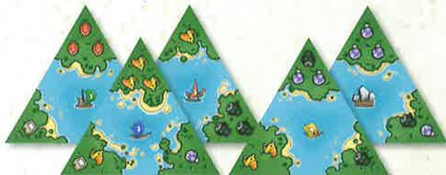
3 tuiles de départ

25 tuiles Flottille (5 séries de 5 tuiles recto/verso)