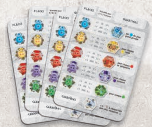
4 aides de jeu