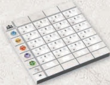
1 bloc de score