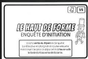
Carte de départ

Lisez tous les textes écrits sur les cartes à haute et distincte voix, car ils contiennent souvent des informations importantes ! De même pour les illustrations.