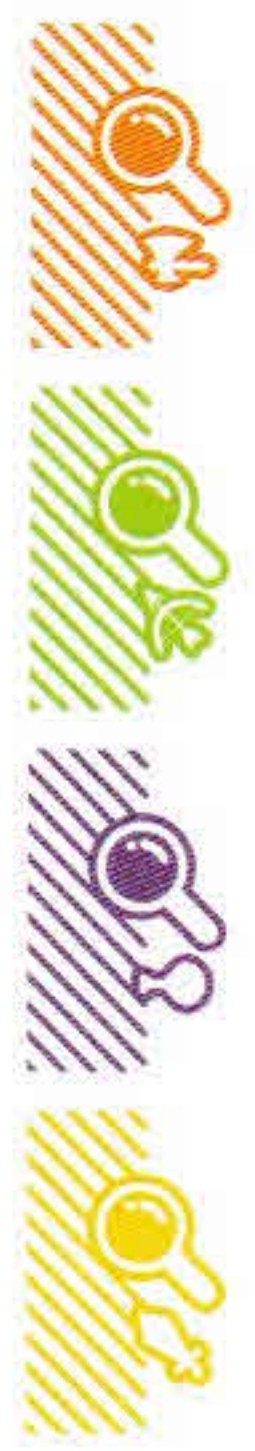
Les quatre types de cases Exploration.

Le joueur qui possède l'action Explorer a la responsabilité d'ajouter de nouvelles tuiles au plateau. Il ne peut le faire que lorsqu'un pion Héros se trouve sur une case Exploration de sa couleur qui mène vers une zone inexplorée.