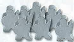
30 frères d'armes