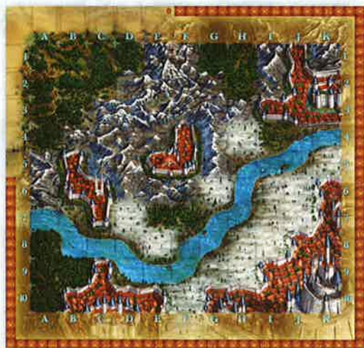
1 plateau de jeu