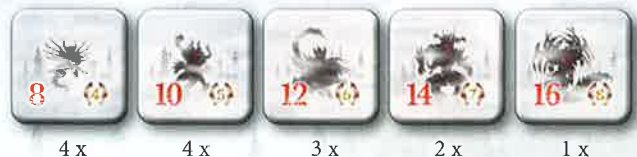
4 x 4 x 3 x 2 x 1 x