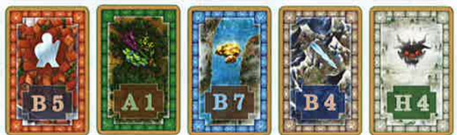
30 x villes 20 x forêts 18 x fleuves 28 x montagnes 14 x « brouillard »