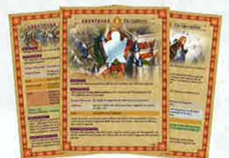
3 cartes « résumé du scénario »