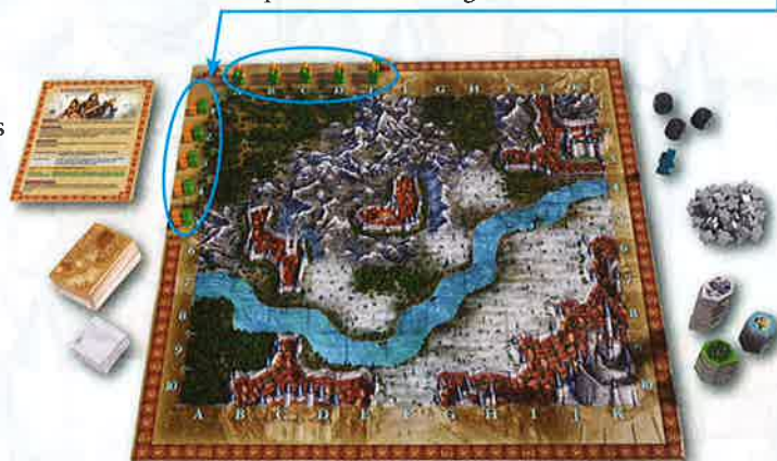
Configuration pour 2 joueurs

Chaque joueur place un aventurier dans la zone de départ sur le bord supérieur gauche du plateau, face aux lignes 1, 2, 3 et 4 et aux colonnes A, B, C et D. Si vous n'êtes que deux joueurs, placez un aventurier supplémentaire chacun dans la zone de départ, face à la rangée 5 et à la colonne E.