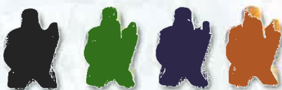
aventuriers (10 de chaque couleur : noir, vert, violet et orange)