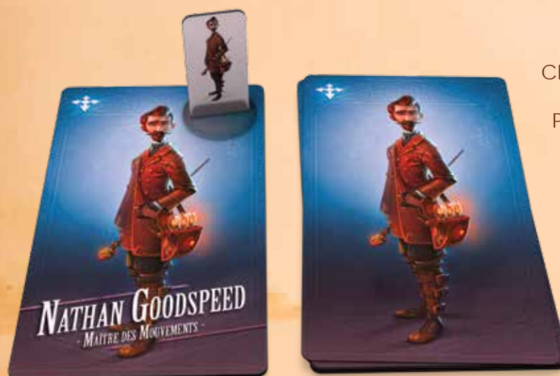
Nathan Goodspeed est prêt à l'action !