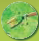
Balai de sorcière