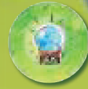
Boule de cristal