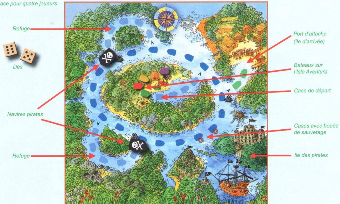
Mise en place pour quatre joueurs

Attention : le nombre de cases de déplacement correspond toujours exactement au résultat du dé. Plus d'explications à ce sujet dans la section « sauvés ! ».