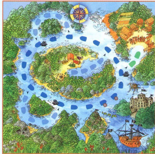
Plateau de jeu