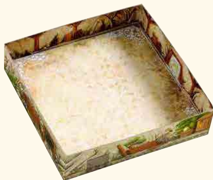
1 mine d'or

(partie inférieure de la boîte avec double fond pour l'effet d'explosion)