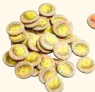
35 pépites d'or licites