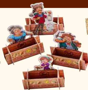
4 personnages avec coffre

(partie inférieure de la boîte avec double fond pour l'effet d'explosion)