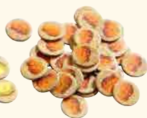
35 pépites d'or illicites