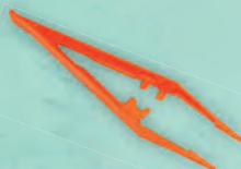
1 Outil de fouille (pince)