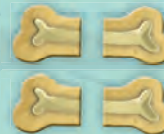
32 jetons Os