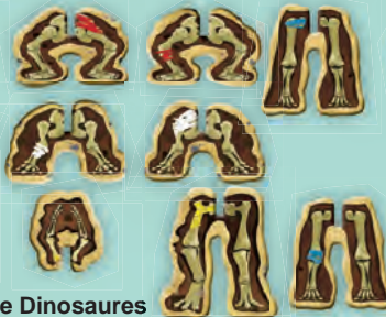
Pattes - 16 tuiles