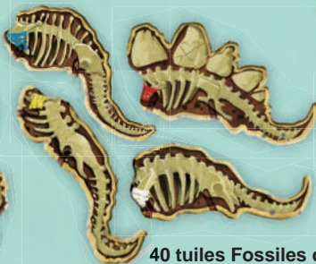
Corps - 8 tuiles