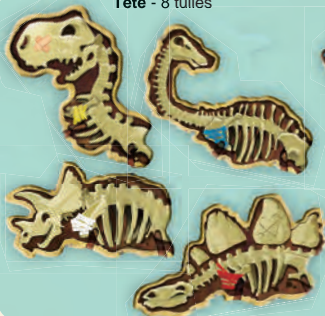
Tête - 8 tuiles