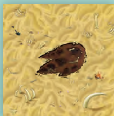
1 Feuille Site de fouille