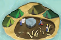
4 tuiles Campements