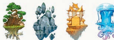
Île volante : Bois / Pierre / Blé / Eau