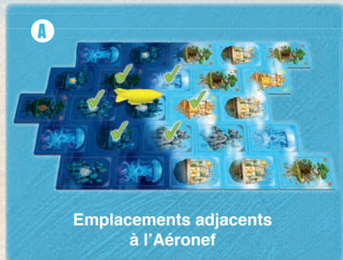
Emplacements adjacents à l'Aéronef

Important : un joueur ne peut jamais posséder plus de 8 ressources. Le cas échéant, il doit défausser les ressources de son choix jusqu'à n'en posséder plus que 8.