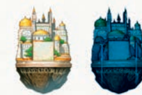
Cité volante : Jour / Nuit