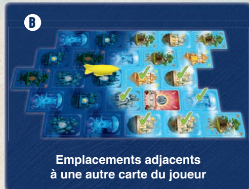
Emplacements adjacents à une autre carte du joueur