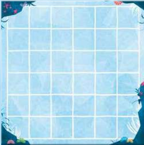
1 plateau Récif