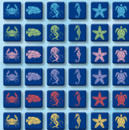
36 tuiles Créature marine